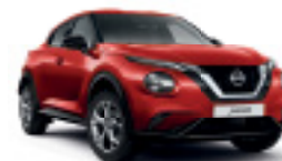
ЧЕРВЕН (C) Z10