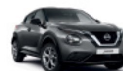
ТЪМНО СИВ (M) KAD