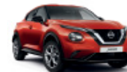
ЧЕРВЕН (M) NBV