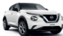
БЯЛ (C) 326