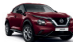
БОРДО (M) NBQ

► Доплащане за цвят металик (M): 750 лв с ДДС.