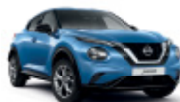
СИН (M) RCF