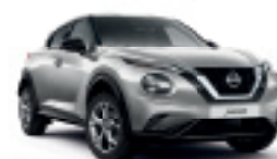
СРЕБЪРЕН (M) KYO