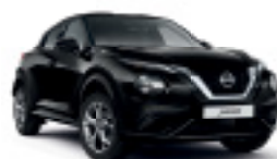
ЧЕРЕН (M) Z11