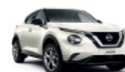
БЯЛ (M) QAV