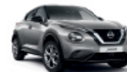
СИВ (M) KBV