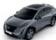
КЕРАМИЧНО СИВ (S) - (KBV)