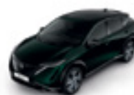
ТЪМНО ЗЕЛЕН (M) - (DAP)