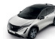
ПЕРЛЕНО БЯЛ С ЧЕРЕН ПОКРИВ (M) - (XGA)

► Доплащане за цвят металик (M): 1,050 лв с ДДС. ► Доплащане за двуцветна комбинация: 2,490 лв с ДДС.