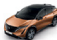
БРОНЗОВ МЕТАЛИК С ЧЕРЕН ПОКРИВ (M) - (XGJ)