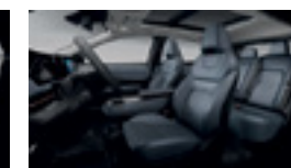
ЕСТЕСТВЕНА КОЖА NAPPA - СИНЯ - ОПЦИЯ ЗА НИВО EVOLVE

Nissan си запазва правото за промяна на цени и спецификации без предварително уведомление.