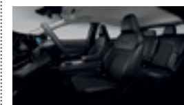
СИНТЕТИЧНА КОЖА И ALCANTARA - ЧЕРЕН ЦВЯТ - EVOLVE