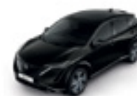
ЧЕРЕН ПЕРЛЕН (M) - (GAT)