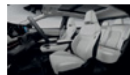
СИНТЕТИЧНА КОЖА И ТЕКСТИЛ - СВЕТЛО СИВ ЦВЯТ - ADVANCE