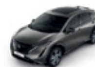
ТЪМНО СИВ (M) - (KAD)