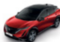
ЧЕРВЕН МЕТАЛИК С ЧЕРЕН ПОКРИВ (M) - (XGD)