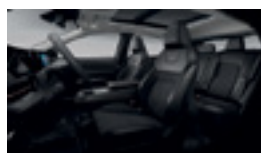
СИНТЕТИЧНА КОЖА И ТЕКСТИЛ - ЧЕРЕН ЦВЯТ - ADVANCE