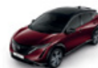
БОРДО МЕТАЛИК С ЧЕРЕН ПОКРИВ (M) - (XGG)